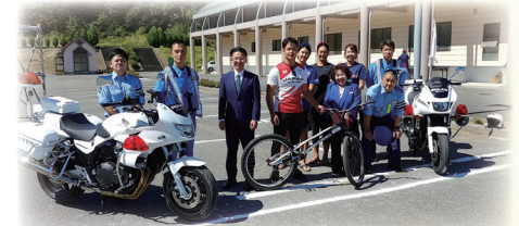
9月24日 山梨県スポーツ推進委員協議会 研究スポーツ大会参加