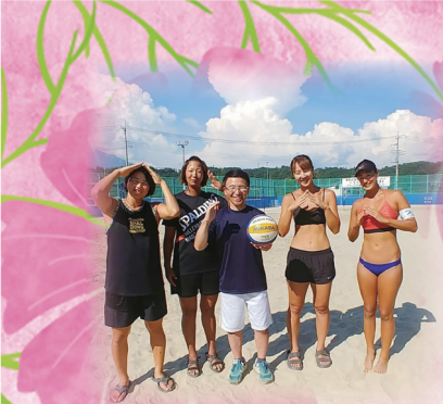
7月29日 白州町のサンドコートで ビーチバレー体験と意見交換