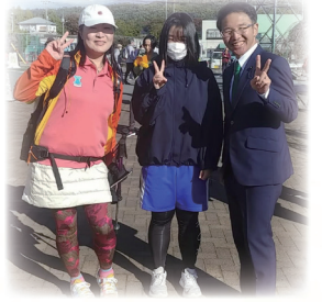
10月29日 北杜市ウォーキングイベントに参加