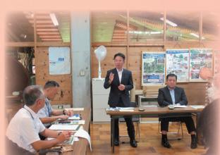
調査では毎回質問を。