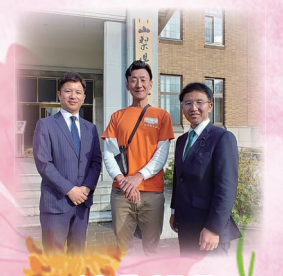
10月27日 山梨県フリースクール連絡会 要望書提出に同席