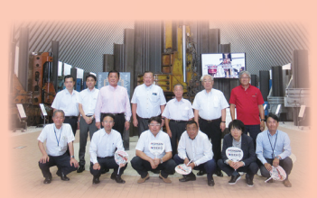
高知県の技研製作所 RED HILL1967にて記念撮影