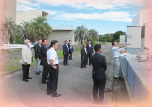
浄水場でバイオマス発電の 取り組みについて調査