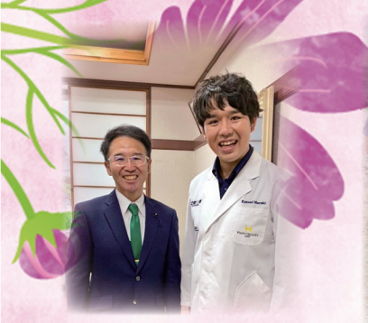
9月8日 炭素回収技術について意見交換