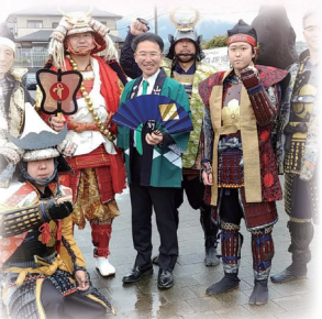
10月15日 甲斐源氏祭り参加

ここでは紹介しきれない多くのイベント、集会、 調査に足を運ばせて頂きました。みなさんとの 交流が政治活動のエネルギーとなります!!