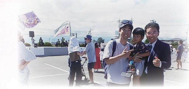
9月10日 北杜よさこい祭参加