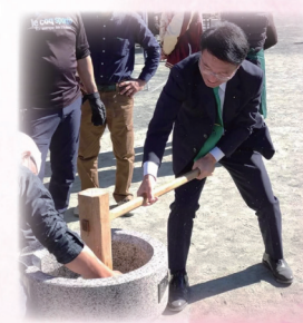
10月22日 武川米まつり餅つき