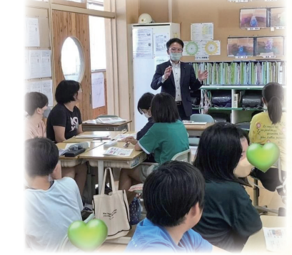
9月12日 SDG s の授業参観