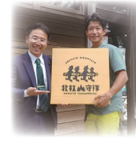
9月20日 北杜山守隊との意見交換