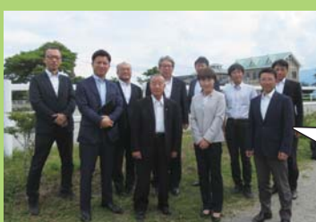
馬事振興センター