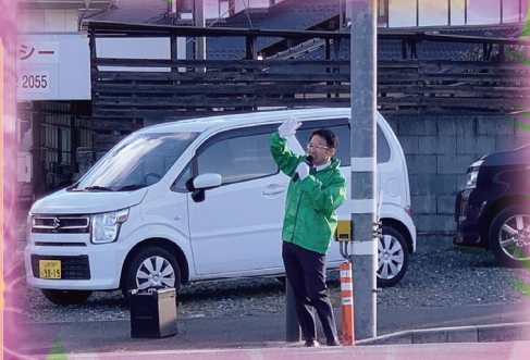
毎月29日(ふくの目)は街頭スピーチ

日常的な活動は SNS で常時発信しています。県政への率直なご意見お聞かせください!!