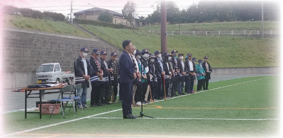
9月26日 北杜市交通安全協会高齢者グラウンドゴルフ大会参加