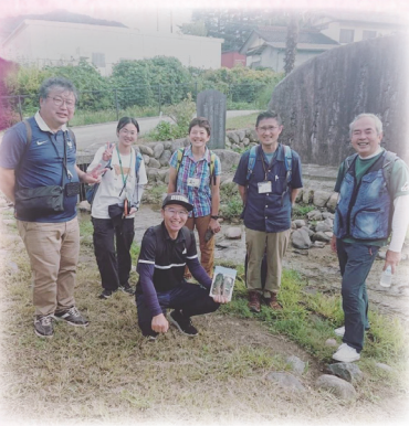
9月9日 白州尾白川フットパスに参加