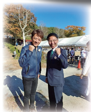
10月22日 小淵沢町ホースショーに参加