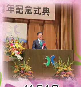
11月1日 北杜市市制施行 19周年 記念式典で祝辞