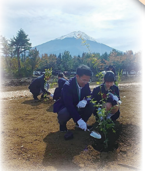
10月19日 国際交流世界の森山梨 キックオフイベント 記念植樹