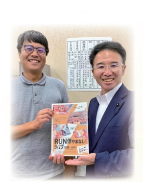
9月6日 RUN 伴山梨との意見交換