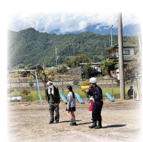
9月3日 消防団員として防災訓練に参加し、 地域住民の防災意識の高揚を図る