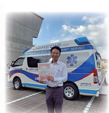
9月3日 医療介護交流会に参加